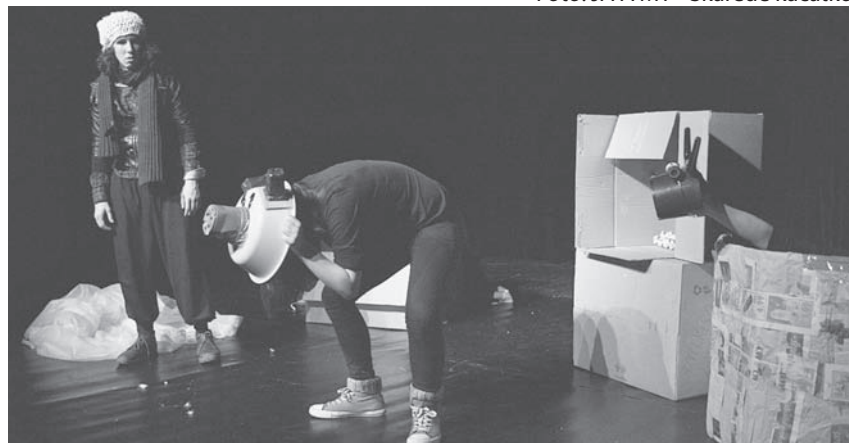
Škaredé káčiatko

Keď už som si myslela, že to nestihnem (divadelný) osud zasiahol, časový harmonogram predstavení sa posunul a ja spolu s ďalšími divadelnými nadšencami sme 29.4. na MS DADu mali možnosť pozrieť si ďalšiu z inscenácií, dovoľm si povedať na AP už domáceho nitrianskeho divadla. Tentokrát pod názvom Škaredé káčiatko. Príbeh zasadený do súčasného prostredia bezdomovcov sľuboval nový pohľad na tento všeobecne známy motív. Zo 4 protagonistov vynikal charakter hlavného hrdinu, ktorý sa cítil nadradený nad ostatnými. Dramatický dej dynamizovala funkčná rekvizita, žltá čiapka, ktorá podľa slov hlavného