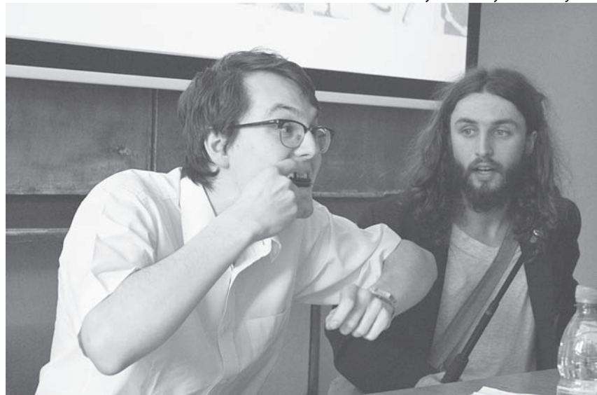
Foto: Inštrumentár slovenských ľudových nástrojov...

ským produkciám sa venujeme v blogu reflexie, kritiky v niekoľkých príspevkoch, pár informácií si však zaslúži prešovský súbor.