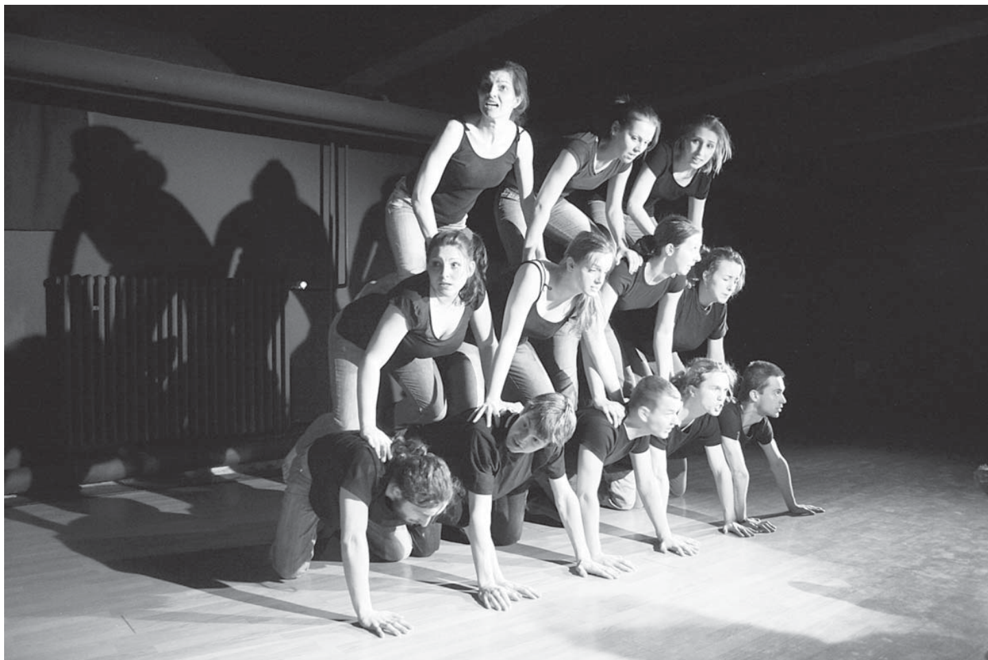
K. Horák: Džura