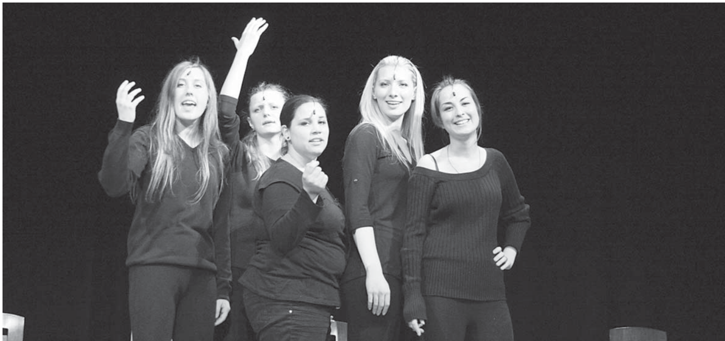
V. Šmihula: Vtáčatko

však pretvoriť a umelecky stvárniť príbeh 16-ročnej Simony tak, aby neplnil len didaktickú funkciu? Dá sa to vôbec? Spracovanie Vlada Šmihulu nenaplnilo očakávanie umeleckej hodnoty. Patetickosť a sentiment tvrdo útočili na našu šedú kôru mozgovú. V mnohých prípadoch si slzy divákov doslova vynucovali. Tam, kde by stačil jemný náznak a diváci by si možno viac odniesli z nedopovedaného, využila sa každá príležitosť zasiahnuť citovú stránku diváka takým spôsobom, aby sa človek cítil ako ignorant a hodnota celej hry sa znížila na obyčajné emocionálne vydieranie.