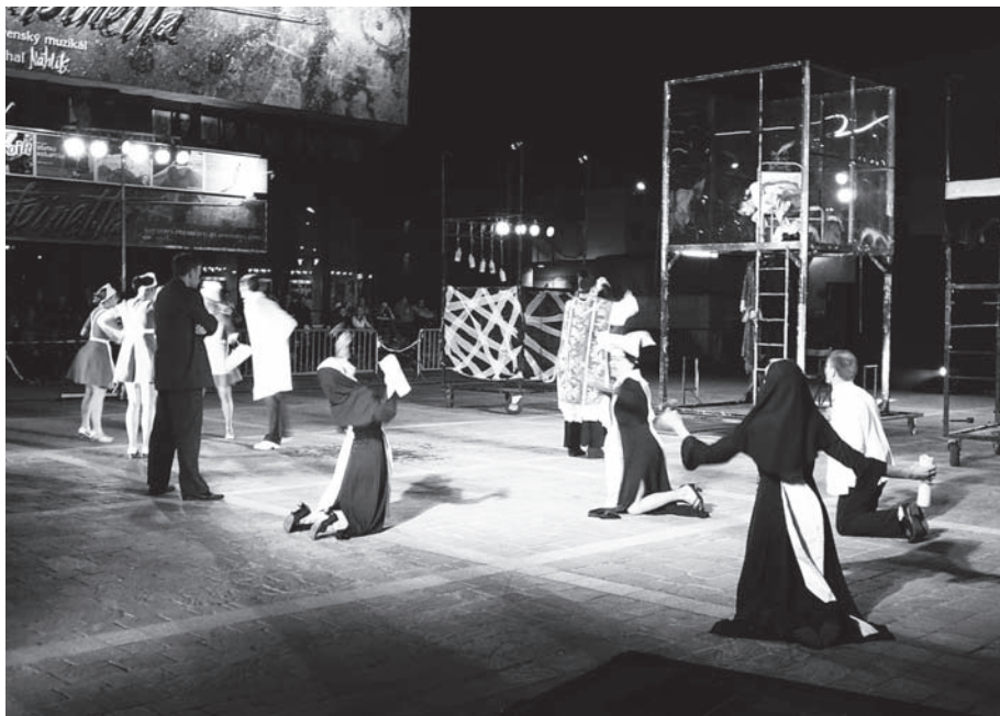
Krakovskí divadelníci ohúrili Prešovčanom svojou monumentálnou divadelnou show.

Naturalistické až halucinogénne vízie chorej mysle, sú dopĺňané realistic-