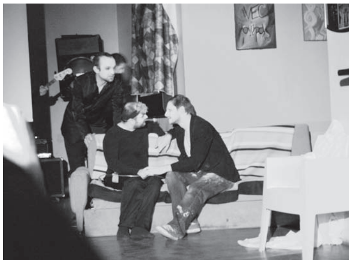
Teatr Bob Krakov.

V autentickom prostredí baru študentského V-klubu na Budovateľskej ulici v Prešove uviedlo krakovské študentské divadlo alúzie na texty špičkového poľského autora Rolanda Topora (Topor je aj po poľsky – veľká sekera). Divadelná kreácia na pomedzí alkoholologickej vízie, sna a reality, v sprievode kvalitnej alternatívnej hudby s pestrými videoprojekciami vytvárala pomerne zážitkový obraz špeciálne prečítaného Topora. Generačne mladému publiku sa to zrejme pozdávalo. Zostali však aj otázky: Čo to bol za herecký štýl? Chvilami „guláš“? Chvilami štylizácia? A potom „brutál“? Najsilnejším zážitkom bola hudba naživo, ktorá neskôr v Christianii zasiahla aj bohato divácky obsadený podnik.