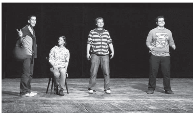
Na improlige bolo veselo.